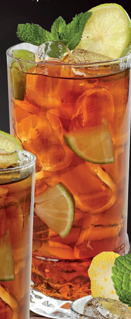
Long Island Vodka, Gin, Rum bianco, Triple sec, Tequila Coca Cola 8,00