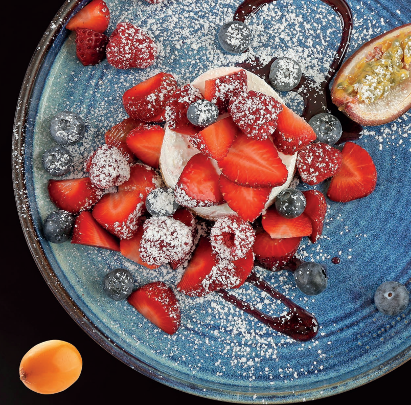
Torta della Nonna Großmutter's Kuchen Grandmother's cake 7,00