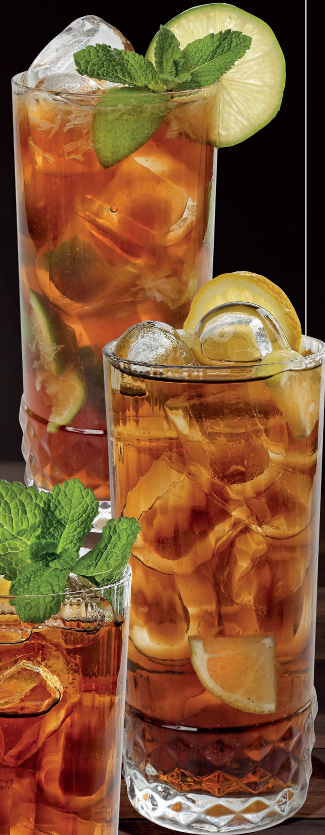
Bacardi Cola Rum Bacardi, Coca Cola 8,00 Cuba Libre Rum, Coca Cola, Lime 8,00