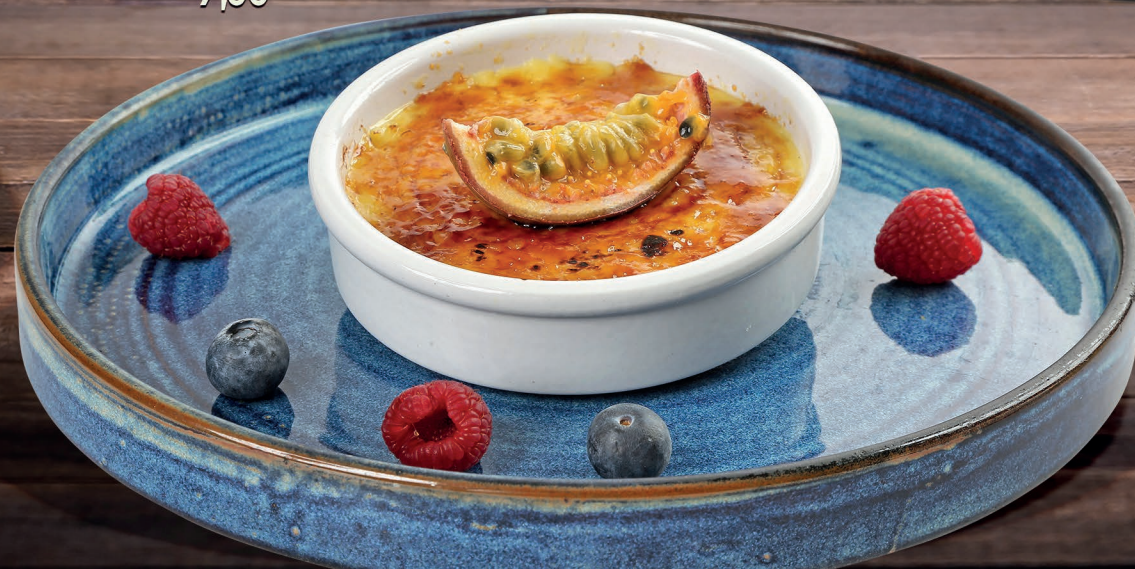
Crema Catalana Katalanische Creme Catalan cream 7,00