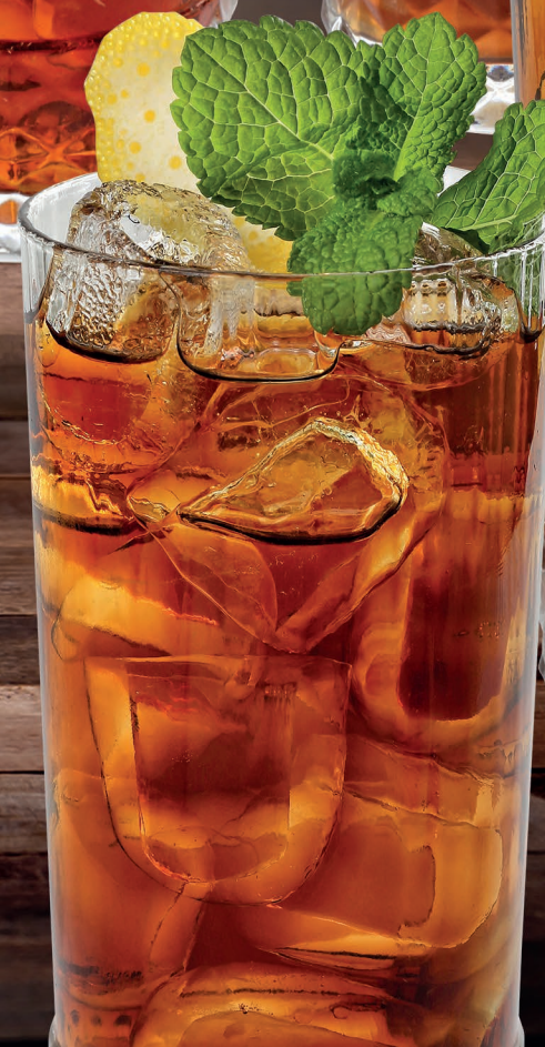
Whisky Cola Whisky, Coca Cola 8,00