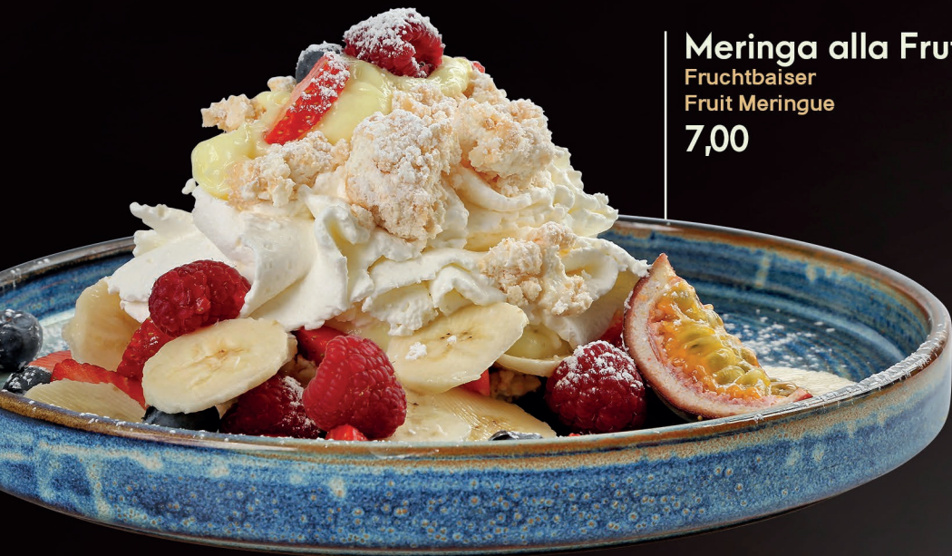
Meringa alla Frutta Fruchtbaiser Fruit Meringue 7,00