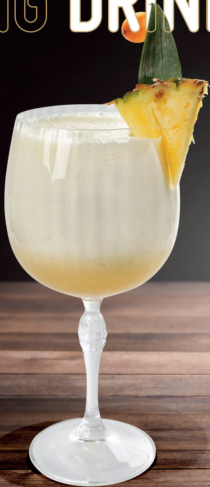
Pina Colada Batida de coco, Rum, Succo ananas 8,00