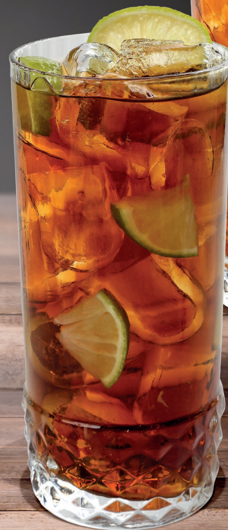
Havana Cola Rum Havana, Coca Cola 8,00