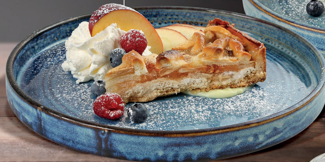
Torta di Mele Apfelkuchen Apple pie 7,00